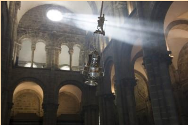
Capa: O Botafumeiro